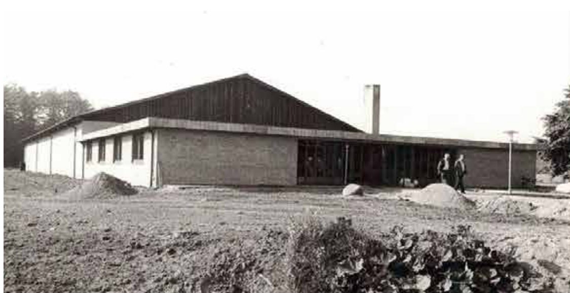
Den færdige hal.