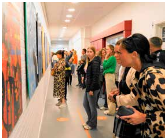
Stor interesse for kunsten.

Initiativet skal også ses i lyset af at Langesø Hallerne og Idrætsforeningen sætter stor pris på det gode samarbejde med skolens ledelse, lærer og elever som vi gerne vil udbygge.