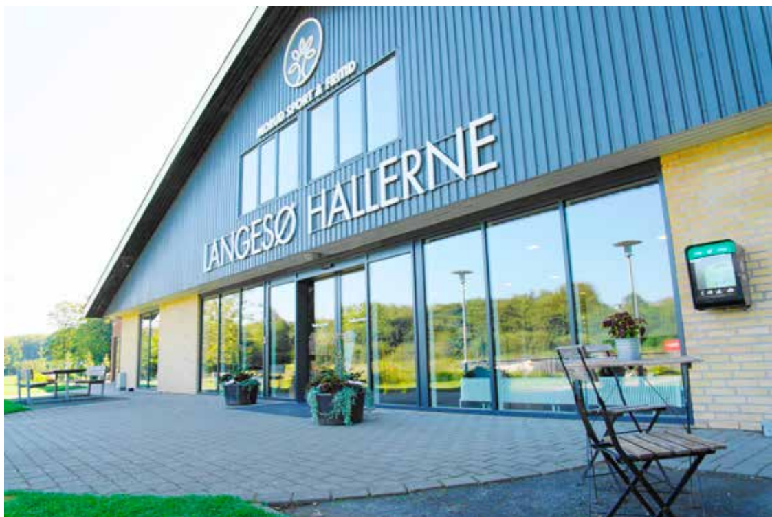
Langesø Hallerne er gode rammer for en god event.