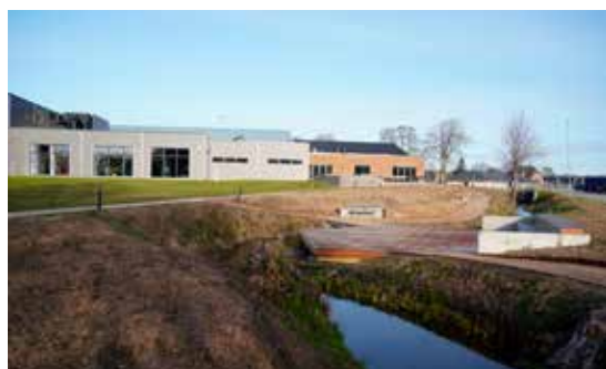
Langesø Hallerne Å-projekt med platform og parkering foran Multihallen.

Anlægget blev bygget med første spadestik 22. marts 2017 og indvielse den 4. oktober 2017. Byggeudvalget og Ka'sælerne hører til den ældre generation, og er enormt glade for at kunne aflevere dette flotte og velfungerende anlæg til den næste generation.