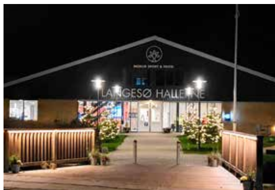
Langesø Hallerne i julestemning.

Med Langesø Hallerne som drivkraft, er alle muligheder til stede for at samle borgerne i og omkring Morud i aktive og sunde idrætsfællesskaber, hvor borgere er sammen om fysiske aktiviteter, der giver motion, stjernestunder og livskvalitet.