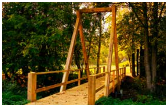
Bro over Stavisåen, som Ka´ Sællerne byggede.

Da Corona krisen ramte Danmark i 2020 og 21 havde Langesø Hallerne heldigvis en robust økonomi, så vi undgik at sende ubehagelige regninger til Langesø Hallernes brugere og lejere. Ikke alle Idrætscentre var så heldige.