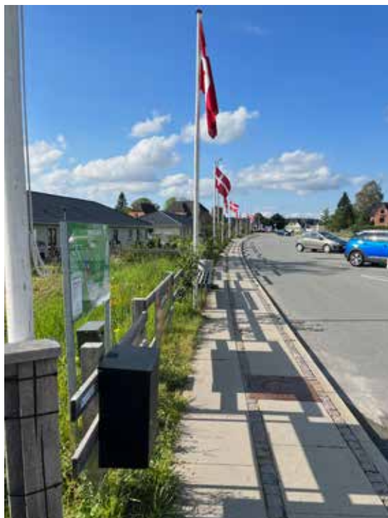
Flaggaleen der var sat op ved Solsikkefesten.