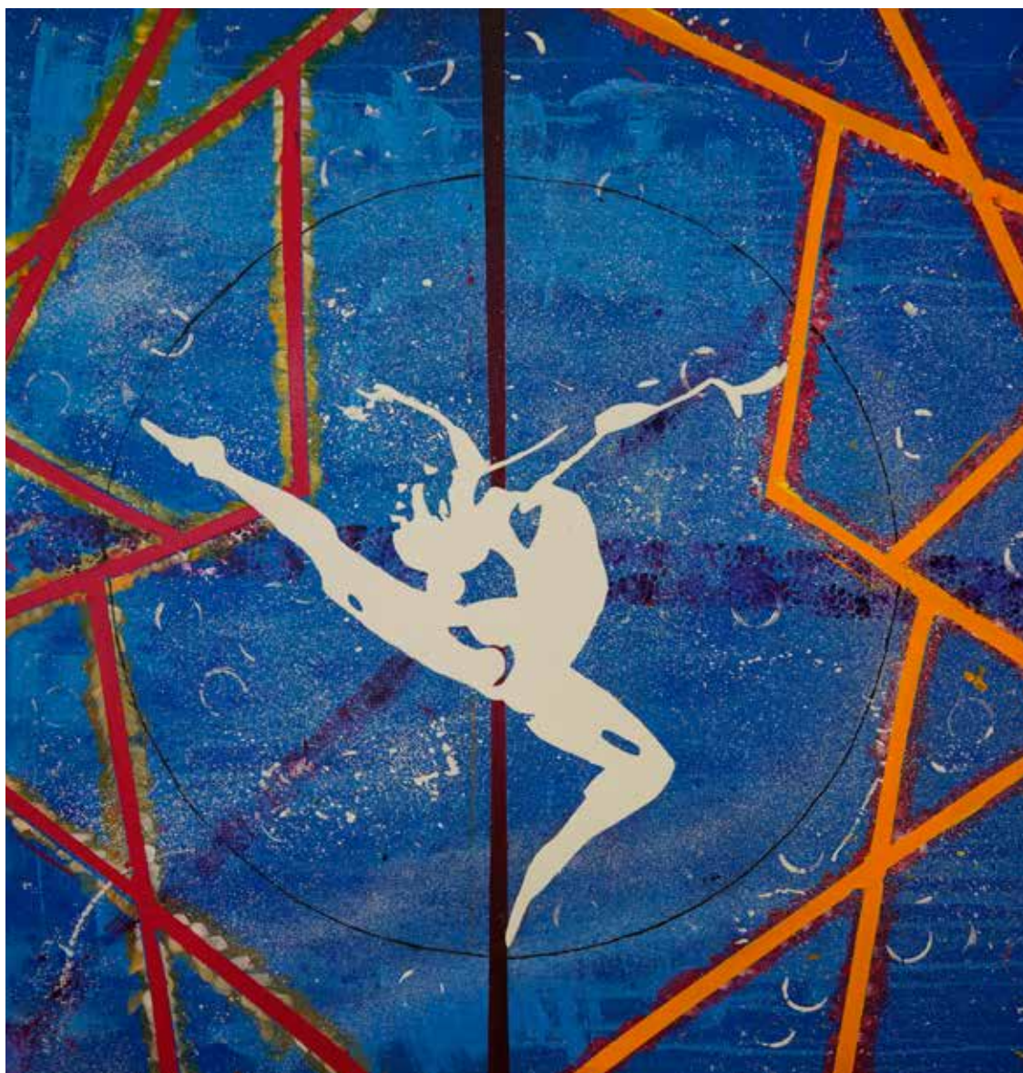
Udsmykning af Langesø Hallerne udført af kreative elever fra Havrehedskolen.

Vi skal også have mere udsmykning på væggene.