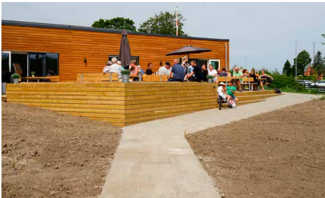
Fliserne op til terrassen giver en god udsigt.