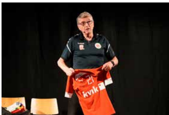
Allan Poulsen har været med i idrættens top og isæt fodboldlandsholdet i en menneskealder.

Fodboldafdelingen arrangerede endnu en spændende sponsoraften den 18. november 2021 med Allan Poulsen, den fynske legende. Foredrag og efterfølgende tarteletter og netværk.