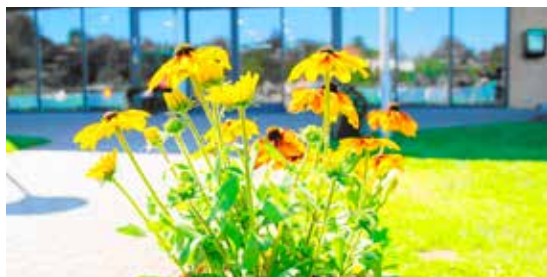
Blomsterpigerne sørger for at skabe hygge.

Dagli Brugsen og så sende mig en faktura. I år var der 230 til bankospillet, og det er samme antal, som der har været de sidste mange år, fortæller Bente Pedersen.