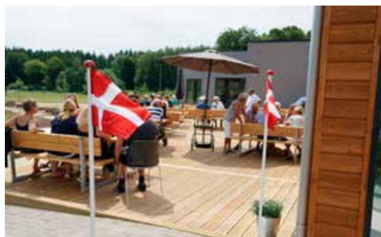
Der var sat flag op, da terrassen blev indviet.

Terrassen bliver brugt meget, og der er en god udsigt ud over fodboldbanen og ned mod Fri-luftsbadet.