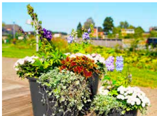
Blomster ved terrassen.