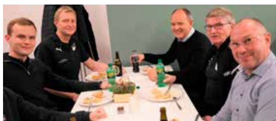
Tarteletter og øl oven på foredraget er godt.