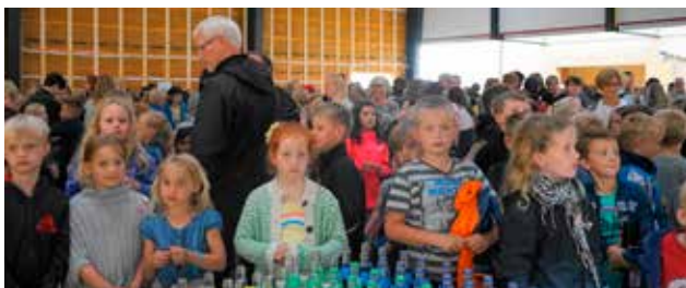
De mange børn ved indvielsen glædede sig over, at der ikke manglede cola og sodavand, da der efter det første spadestik blev hygget.