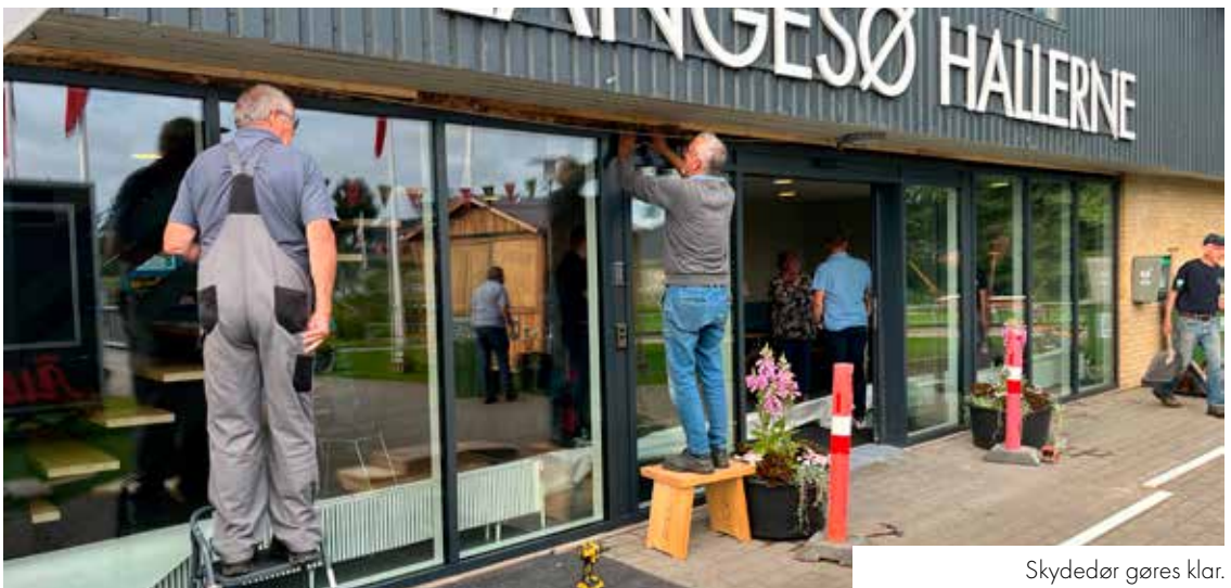
Skydedør gøres klar.