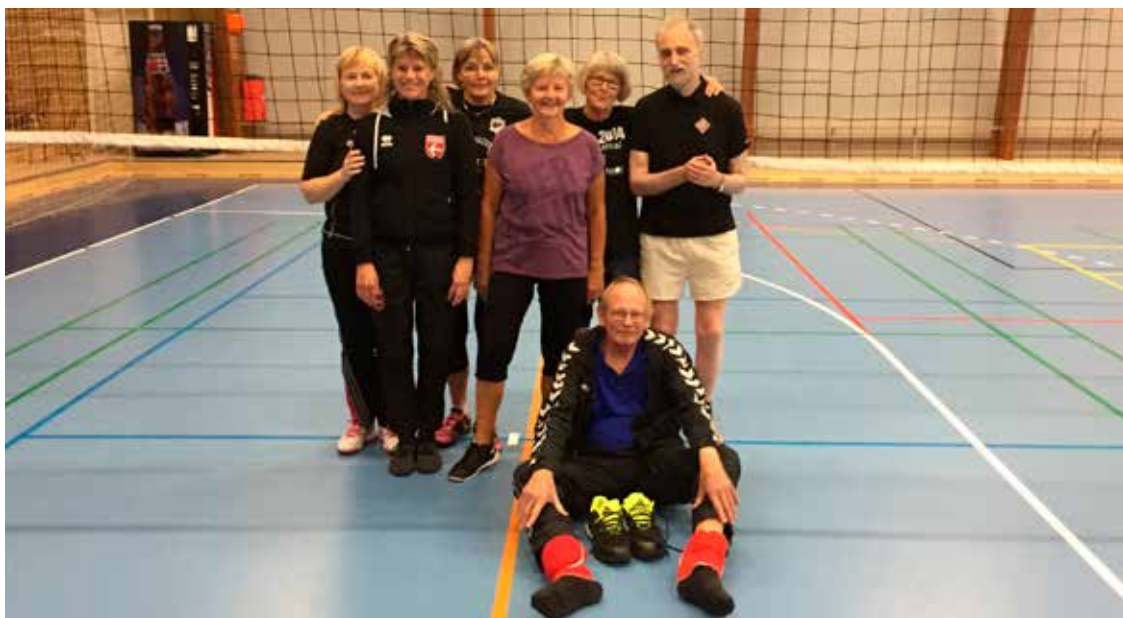
Dengang der blev spillet volley i Morud.