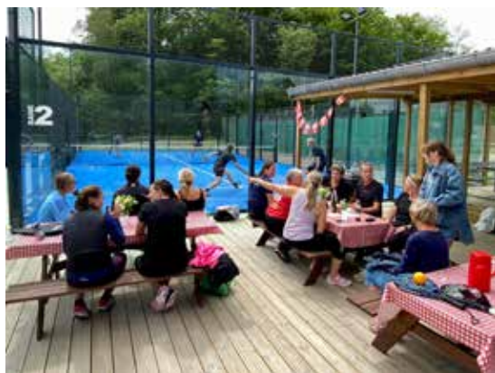
Terrassen giver flotte rammer ved tennis- og padelanlægget.

Tennisafdelingen har de seneste år udvidet anlægget med to gode og flotte padelbaner, dermed hedder foreningen nu Morud tennis og padel. Anlægget har kostet ca. 1,5 million at opføre og står nu færdigt. Projektet kunne realiseres med økonomisk tilskud fra Nordfyns Kommune, samt lån fra flere af de andre afdelinger i foreningen. Med 250 medlemmer i foreningen, er der stadig god plads på både tennisbaner og på padelbaner. Vores vision var at give foreningens medlemmer et godt og flot anlæg. Her kan der udfordres ligesindede i begge sportsgrene, og der er etableret en base for at nye fællesskaber kan opstå på kryds af alder, køn og niveau.