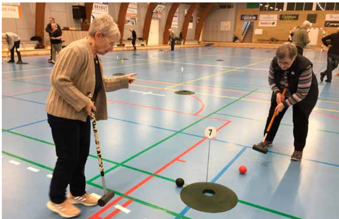
Krolf er et meget populært udendørs spil, men der spilles også krolf i Hallen. Der spilles torsdag eftermiddag. Det har krævet anskaffelse af meget udstyr. Med bløde bolde af læder, forhøjninger med huller og numre.