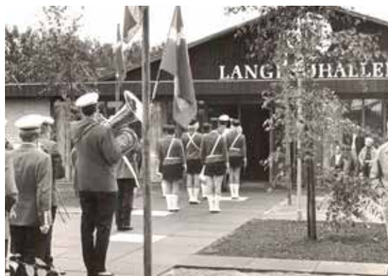
Odense Postorkester underholdt ved indvielsen i 1973.