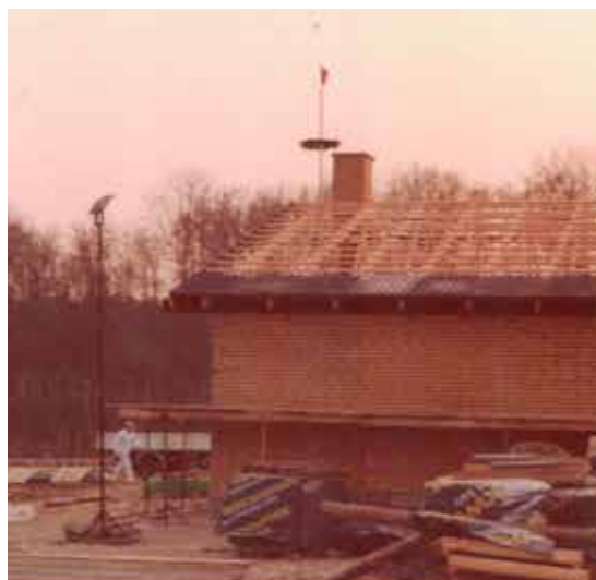
Der var rejsegilde i 1972 .

Den officielle indvielse fandt sted den 29/30 september 1973 med reception og en stor fest, samt to dages fyldigt program med sport, musik.