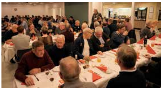
Der var god mad og hygge oven på foredraget.

I 2020 arrangerede Fodboldafdelingen en succesfuld sponsoraften med den kendte fodboldspiller og TV-fodboldkommentator Jan Mølby i en fyldt Multihal. Et spændende arrangement med efter følgende middag og netværk.