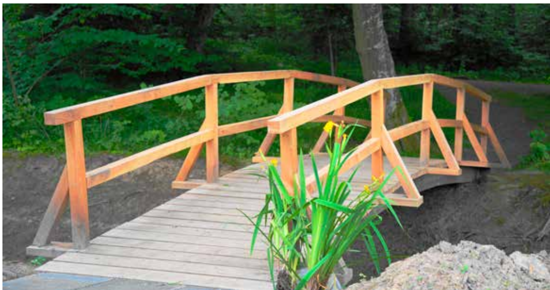
Claude Monet Broen ved skoven bag svømmebadet, der blev indviet 10. juni 2021.

Langesø Hallernes opgave er at drive centret og sørge for gode faciliteter til Idrætsforeningen og udvikle stedet som Moruds mødested. Langesø Hallens bestyrelse arbejder ulønnet og har i