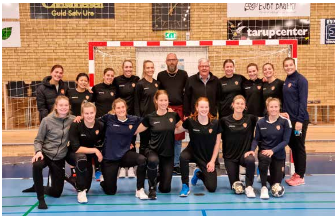
Odense Håndboldklub havde den 21. oktober 2021 træning i Langesø Hallerne.